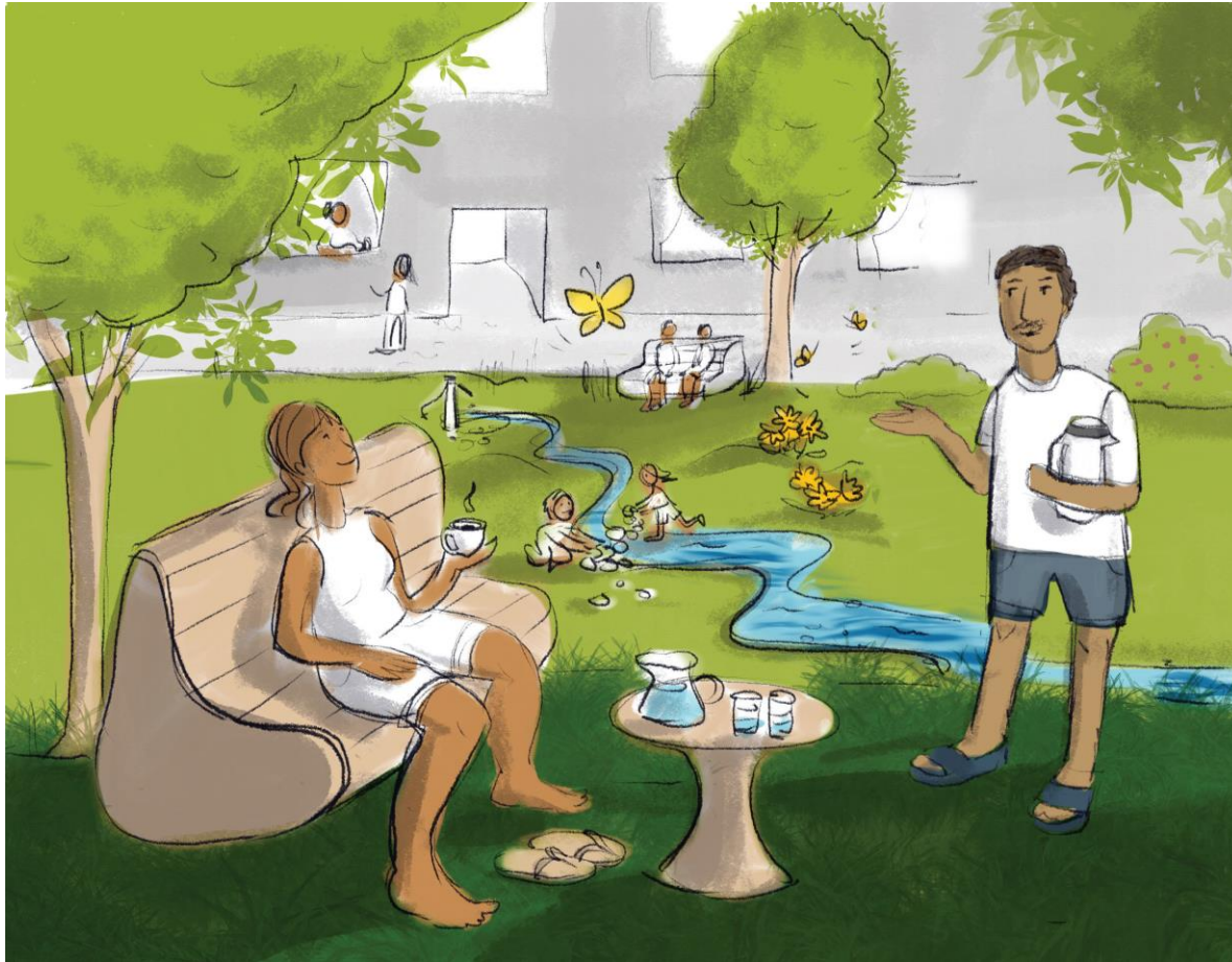
© Umweltbundesamt/ Daniela Waser, illustrating change