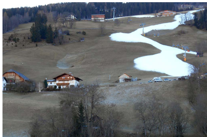
Abbildung 1: Der Schneemangel wird sich in Zukunft bei niedrigergelegenen Skigebieten stark bemerkbar machen.

Die Fallstudien zeigen, dass die interviewten Akteure durchaus erste Anzeichen der klimatischen Veränderung erkennen - vor allem im niedriger gelegenen Annaberg. Hier wurden eine Verschiebung der Wintersaison nach hinten und eine Zunahme extremer Wetterereignisse wahrgenommen. In den letzten 10 Jahren wurde eine Häufung von schneearmen Wintern festgestellt, die massive wirtschaftliche Auswirkungen hatte. In der Skicircus-Region gibt es ähnliche Beobachtungen zu klimatischen Veränderungen in der Wintersaison. Diese konnten jedoch aufgrund der Höhenlage, der Schigebiets- und Betriebsgröße sowie einer guten Entwicklung der Sommersaison wirtschaftlich deutlich besser abgefedert werden. Trotz dieser Erfahrungen ist eine Skepsis gegenüber wissenschaftlichen Aussagen zum Klimawandel vorhanden. Den Akteuren erscheinen Aussagen von Studien je nach Auftraggeber widersprüchlich und sie können für sich selbst oft keine Schlussfolgerungen daraus ziehen. Sie äußerten den Wunsch nach regionsspezifischen Fakten und Informationen, die für die Zukunft ihres Betriebs relevant sind.